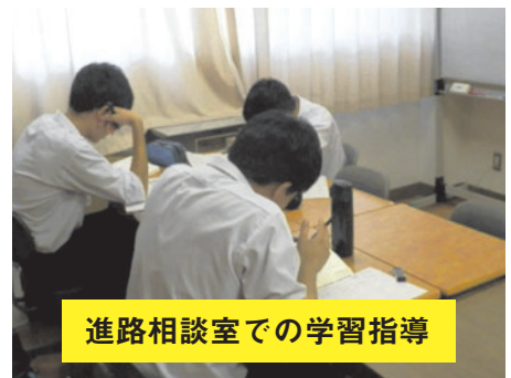
進路相談室での学習指導

春日井高校独自のデータベースを用い、個々の生徒の学力を分析した詳細な資料を提供しています。