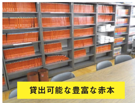
貸出可能な豊富な赤本